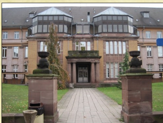
Hôpital civil de Strasbourg

Paul Bonatz, un architecte de Strasbourg et d'Ankara