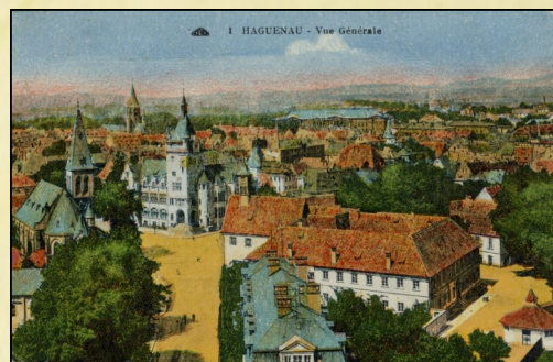
Carte postale et vue générale de Haguenau sur Haguenau Avant

Le bâtiment du Gymnasium est de style wilhelmien en brique orange avec un encadrement des portes et des fenêtres en grès rose des Vosges.