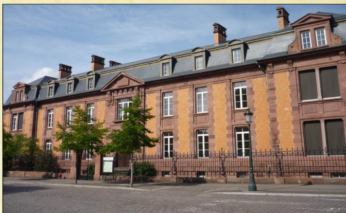
Le bâtiment B du Collège Foch