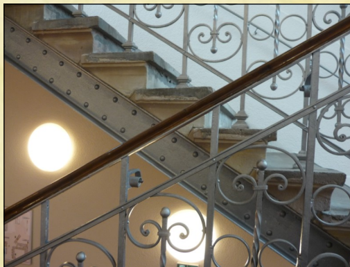
Escaliers intérieurs du Bâtiment B